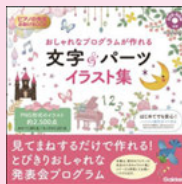
イラスト:小倉マユコ、尾田瑞季、川村世依子、酒井千絵 1,620円(税込) 学研プラス

「大人っぽいおしゃれなイラストが欲しい!」という声にお応えして、おしゃれなテイストのイラストデータを、約2,500点収録。発表会のプログラム作りが楽しくなるような、個性あふれる4つのテーマに沿ったイラスト集。