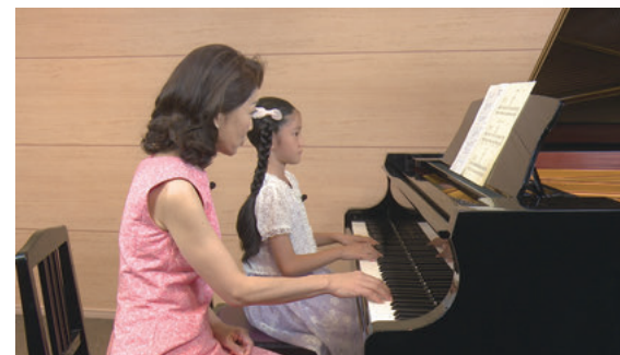
レッスン風景 (「バーナムレッスンDVD」より)

速さに関してもタイトルに大きなヒントがあります。「熊のように歩こう」では大きな熊が重い体を揺すって歩くようなイメージを表現できるテンポが理想です。タイトルに最もふさわしいテンポが正しいテンポでしょう。