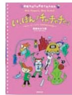
春畑セロリのきまぐれんだん いっほん! チャチャチャツ (音楽之友社)