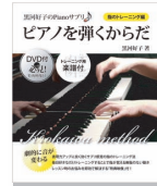
ピアノを弾くからだ<指のトレーニング編> (ヤマハミュージックメディア)

「フランスとは何か」、その定義に始まって、いまだフランス国家というものが成立していなかった中世から21世紀まで、ダイナミックに変貌する音楽史を一望する。類書のない書き下ろしの労作。音楽を通して、変わるフランス、変わらざるフランスが明らかに。