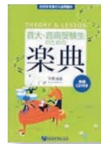
音大・音高受験生のための楽典 THEORY&LESSON (バンセ・ア・ラ・ミュージック)