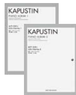
カプースチン ピアノアルバム1-2 (プリズム)