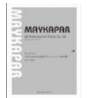
マイカバル ペダルのための 20のプレリユード作品38 (プリズム)