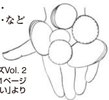
とっておきのぴあれんキッズVol. 2 61ページ 「えんそう前のおまじない」より

例えば・・・途中で忘れちゃったらどうしよう。指がすべってころんじゃったら・・・どうしても、出来ないところが心配。先生やお母さんをはがっかりさせちゃったら・・・指が冷たくなったら・・・おなかや痛くなるかも・・・お客様の視線がこわい・・・など