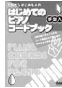
はじめての ピアノコードブック (中央アート)