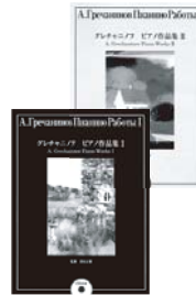
グレチャニノフ ピアノ作品集 I・II (ヤマハミュージックメディア)