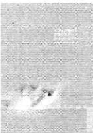
ピアノが弾ける 3つのステージ