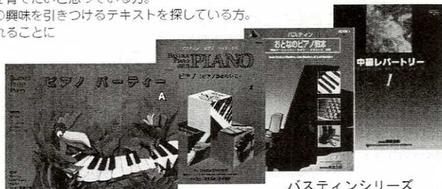
バスティンシリーズ