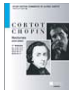
コルトー版 ショパン ノクターン 第1集 (全音楽譜出版社)