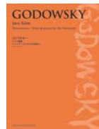
ゴドフスキー ジャワ組曲 (プリズム)