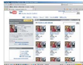
(バスティン・チャンネル)

インターネットを活用すると、様々な音楽情報に無料でアクセスすることができます。音楽配信サービスから楽曲をダウンロードし、ipodなどで楽しんでいる方も多いことでしょう。