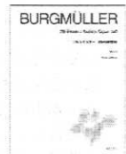
ブルグミュラー25の練習曲 New Edition