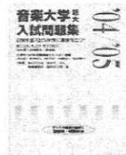
音楽大学・短大入試問題集