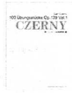
新・ツェルニー100番練習曲

2003年度・2004年度・2005年度 編集部編 本体3800円+税 12月12日発売予定