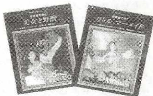
美女と野獣/リトルマーメイド