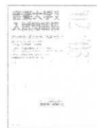
音楽大学・短大入試問題集 02/03