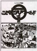
こども ピアノワールド Take II Keys編